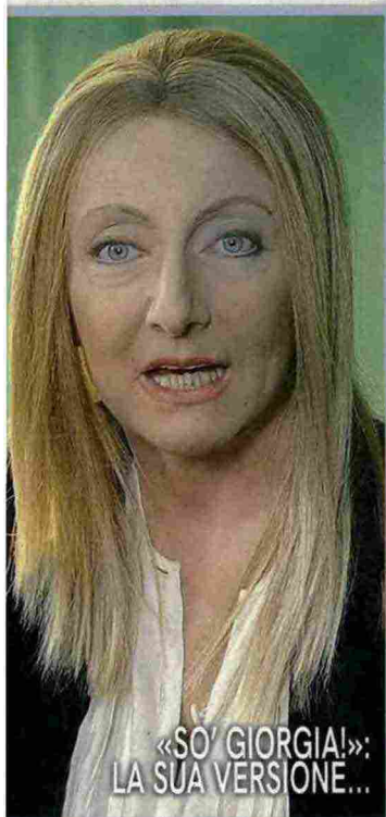
«SO' GIORGIA!»: LA SUA VERSIONE...