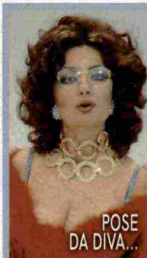
POSE DA DIVA...