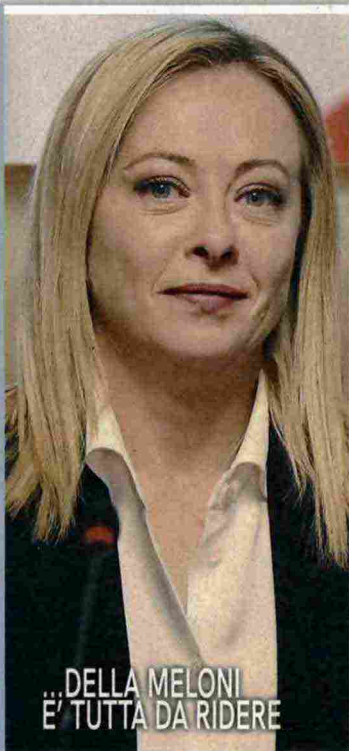
...DELLA MELONI E' TUTTA DA RIDERE