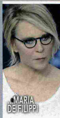
...MARIA DE FILIPPI