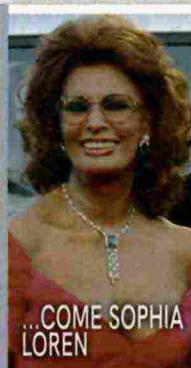
...COME SOPHIA LOREN