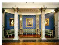
MUSEO TEATRALE ALLA SCALA