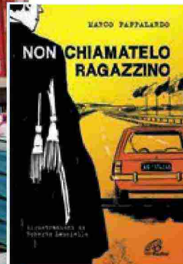
NON CHIAMATELO RAGAZZINO Di Marco Pappalardo Edizioni Paoline