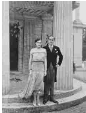
EDDA MUSSOLINI GALEAZZO CIANO

riproporre i tanti interrogativi ai quali gli storici di professione non hanno saputo fornire risposte definitive che non fossero soltanto risultato di congetture troppo spesso arbitrarie. Perché, per esempio, Mussolini decise all'improvviso di convocare la seduta del Gran Consiglio? Come si spiega il suo atteggiamento durante la riunione? E che cosa pensa Ciano, in quel frangente, del suo rapporto con il suocero? Che cosa lo ha spinto, davvero, a operare una scelta di campo così gravida di conseguenze? E via dicendo.