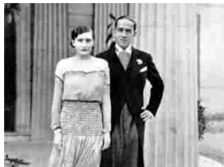
EDDA MUSSOLINI CON GALEAZZO CIANO

riproporre i tanti interrogativi ai quali gli storici di professione non hanno saputo fornire risposte definitive che non fossero soltanto risultato di congetture troppo spesso arbitrarie. Perché, per esempio, Mussolini decise all'improvviso di convocare la seduta del Gran Consiglio? Come si spiega il suo atteggiamento durante la riunione? E che cosa pensa Ciano, in quel frangente, del suo rapporto con il suocero? Che cosa lo ha spinto, davvero, a operare una scelta di campo così gravida di conseguenze? E via dicendo.