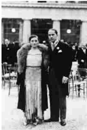
EDDA MUSSOLINI GALEAZZO CIANO