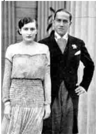
GALEAZZO EDDA CIANO

Ambizioso e salottiero, finito in diplomazia e in politica non per sua volontà avrebbe voluto fare il letterato, il critico o l'autore teatrale - Galeazzo non era neppure, a guardar bene, un fascista vero e proprio ma era piuttosto un conservatore ritrovatosi, soprattutto dopo il matrimonio con la figlia del Duce, al centro di una attenzione che lusingava la sua vanità. Poco alla volta si era convinto di essere davvero, come gli sussurravano gli adulatori di turno, il successore predestinato del suocero. E ciò era talmente vero che egli, forse inconsciamente, aveva finito per imitarlo, nei gesti e nel portamento.