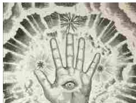
Animali reali e animali simbolici