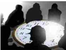
Ombra e Potere - Prima parte