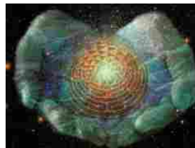
Re del mondo, custodi della tradizione primordiale e superiori incogniti