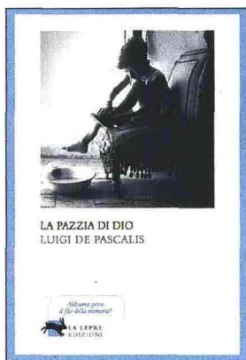
ROSSO VELABRO , un romanzo che si svolge nel 363, ha permesso a Luigi De Pascalis di farsi conoscere dal grande pubblico nel 2003

C on La pazzia di Dio ( La Lepre ) Luigi De Pascalis abbandona il giallo ambientato nell'antichità pagana e il fantasy mescolato al folklore (due generi o sottogeneri, a lui congeniali) e ci propone un bel romanzo storico in forma di saga familiare, scritto con una lingua affabile, a tratti poetica (l'uso dell'anafora), a tratti vicina all'oralità (e anche se io personalmente continuo a prediligere la detective story dentro Roma antica). Si tratta della vicenda di Andrea Sarra, che pure proviene dall'opera precedente ( Il labirinto dei Sarra ), e della sua affollata famiglia tra il 1895 e il 1924, in un paesino immaginario alle pendici della Maiella, Borgo San Rocco (come nell'ultimo Sandro Veronesi di XY , e il suo Borgo San Giuda). La Grande guerra, l'epidemia di Spagnola che falcia un'intera generazione, la fine del "mondo magico" della civiltà contadina (quello studiato da de Martino e Carlo Levi) e poi le guerre coloniali, la nascita del fascismo, e anche qualche personaggio famoso che entra in scena, come Boccioni e D'Annunzio, orbo di