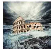
IL NIDO DELLA FENICE LUIGI DE PASCALIS NARR. FANTASCIENFICITÀ