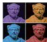
IL MANTELLO DI PORPORA di LUIGI DE PASCALIS

Figura indubbiamente fascinosa, questa dell'ex-ragazzino confinato nella solitudine di Macellum, che Costanzo poi metterà a capo delle truppe in Gallia, quasi tacitamente aspettandosi l'eliminazione sul campo; e che, invece, si rivelerà un genio tattico di livello cesariano, sconfiggerà i barbari e infiammerà le truppe al punto da esserne proclamato imperatore, a sua volta. Arrivato dunque al potere, Giuliano emanò un brusco contrordine: al Cristianesimo andava sostituito di nuovo il culto di Zeus e degli dei dell'Olimpo, o magari anche, in alternativa, quello di Helios, il sole divinizzato, la cui massima festa era il giorno natalizio, il 25 dicembre... Il progetto naufragò, perché meno di tre anni dopo Giuliano, al comando di