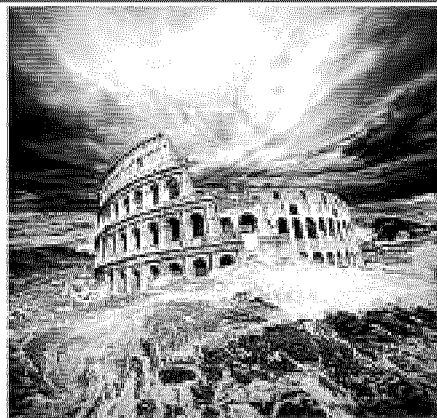
IL NIDO DELLA FENICE LUIGI DE PASCALIS NOIR, FANTASCIENTIFICO

che abita su New World, una piattaforma galleggiante da cui si controlla lo Scudo, il sistema d'informazione e di controllo globale. A Pantelleria si succedono efferati omicidi dall'impronta rituale, che paiono scimmiettare antichi culti. Versi poetici si alternano a momenti di azione pura attraverso uno stile fluido che ricorda il pennello sulla tela. Il passato e il futuro si fondono nell'eterno presente dell'umanità, sempre in lotta per sopravvivere a se stessa. Solo De Pascalis poteva regalare al panorama letterario nostrano un'opera tanto ardita.